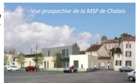
Vue prospective de la MSP de Chalais

Les professionnels (3 médecins, 3 infirmiers et 2 dentistes) ont une année pour préparer leur installation dans les nouveaux locaux. Ces professionnels adhèrent à l'association du Pôle de santé de Chalais, Aubeterre, Brossac et St Séverin qui regroupe une vingtaine de professionnels pour la mise en œuvre d'un projet de santé. Après la Maison de Santé Pluridisciplinaire, la création d'un système informatique sera étudiée pour faciliter l'échange de données entre professionnels (1 ère réunion le 15/10/2014).