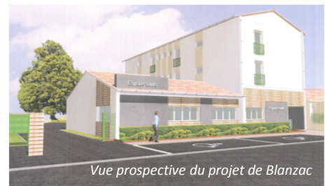
Vue prospective du projet de Blanzac

Démarrage des travaux mi 2015 : le projet consiste à transformer les anciens locaux de la gendarmerie pour accueillir des paramédicaux. Un travail est également engagé avec le cabinet médical qui accueille régulièrement des internes en médecine générale.